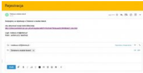
3. Mail potwierdzający z linkiem