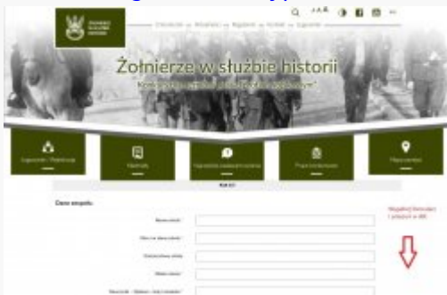
5. Dane szkoły, opiekuna i zespołu