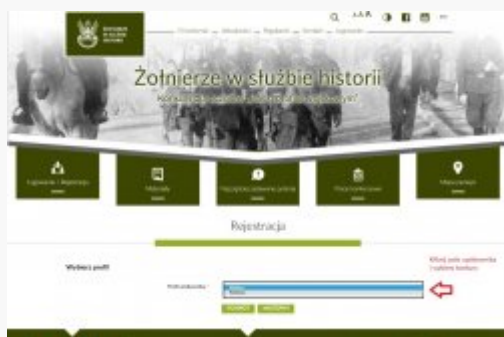
1. Pierwsza rejestracja do konkursu

Automatycznie wszystkie prace przestaną być edytowalne po 28.06.2018.