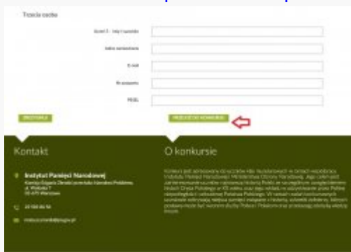
6. Przejdź do konkursu