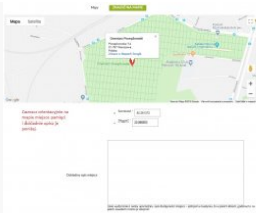
8. Mapa i orientacyjny znacznik