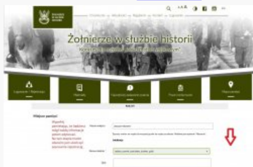
7. Wstępne uzupełnienie - miejsce pamięci