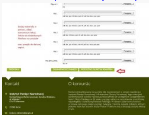
11. Przejdz do -