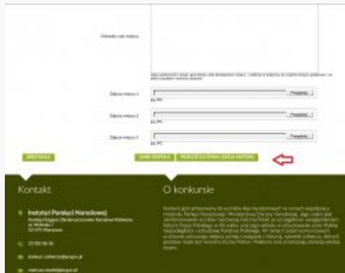
9. Przejdz do - żywa