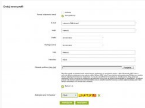
2. Login i hasło