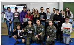
Żywa lekcja historii, fot. Agnieszka Kaczyńska