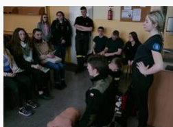
Żywa lekcja historii