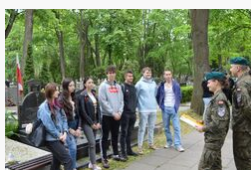
Żywa lekcja historii, fot. Dariusz Gizicki